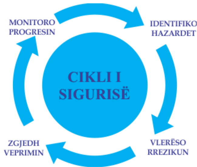
Figura 1: Një proces i thjeshtë i menaxhimit të rrezikut